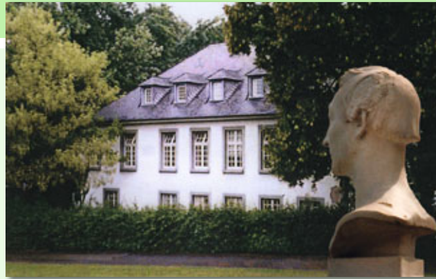
Geburtshaus Konviktstraße 4, Bonn

Lenné war vor allem in ganz Preußen, in den Rheinprovinzen in Aachen, Bad Neuenahr, Benrath, Bonn, Brühl, Koblenz, Köln, Sinzig und Stolzenfels tätig.