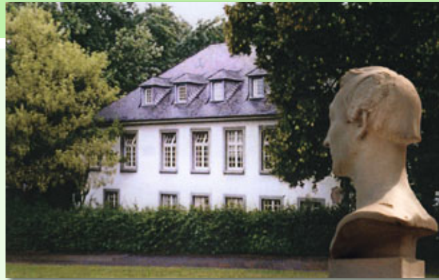
Geburtshaus Konviktstraße 4, Bonn

Lenné war vor allem in ganz Preußen, in den Rheinprovinzen in Aachen, Bad Neuenahr, Benrath, Bonn, Brühl, Koblenz, Köln, Sinzig und Stolzenfels tätig.