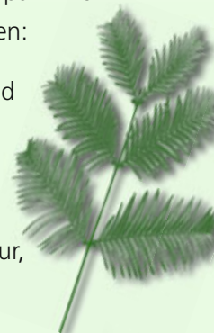
Zweig vom Urweltmammutbaum im Stadtgarten

1811/12 Studienaufenthalt in Paris: Studium der Botanik und Architektur, sowie Praktikum im Jardin des Plantes